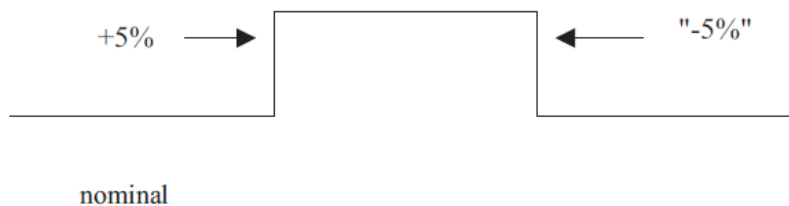
Figure 4. Application of test signal